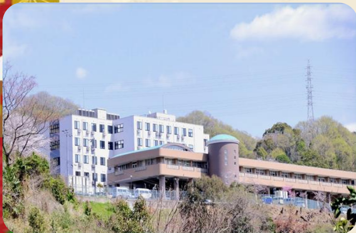
医療法人慈孝会 福角病院・福角の里