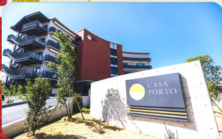
サービス付き高齢者向け住宅 カーサポルト北条の海