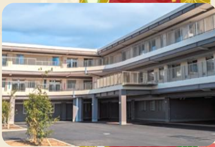
社会福祉法人安寿会 特別養護老人ホーム 安寿荘